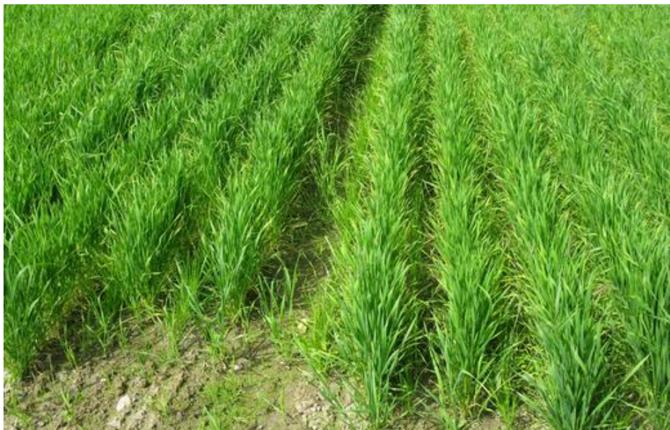
Etablering av engsvingel sådd i annenhver sålabb med Bjarne vårhvete som dekkvekst.

Dersom en har mulighet for det, er det en god etableringsmetode å så dekkvekst og engsvingel i annenhver labb. I økologiske frøavlsforsøk gav denne metoden 20 % større frøavling i første engår sammenlikna med kryssåing i to arbeidsoperasjoner, og dette var klart økonomisk lønnsomt til tross for redusert kornavling i gjenleggsåret. På grunn av bedre tilgang på lettløselig nitrogen er det rimelig å tro at avlingsutslaga både for korn og frø vil være mindre, men at metoden likevel vil være lønnsom også ved konvensjonell frøavl.