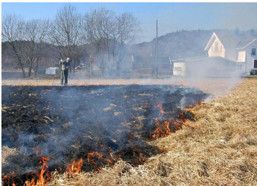
Brenning er en effektiv metode til å bli kvitt daugraset om våren i engsvingelfrøenga.

stripe (om lag et par meter brei) langs alle kantene av enga, før resten av enga brennes, gjerne mot vindretningen.