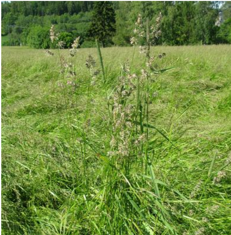
Hundegrass kan være vanskelig å rense fra engsvingelfrøet og bør lukes bort før høsting.

Kveka må bekjempes med planmessig bruk av glyfosat i åra før gjenlegg. Dersom en er redd for at det fortsatt er kveke igjen på arealet i gjenleggsåret, vil det beste være å så engsvingelen uten dekkvekst. Kveka bør da vokse uforstyrret fra våren av, og så sprøytes med glyfosat ca 1 uke før jordarbeiding og såing av engsvingelen.