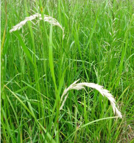
Kvitaksmidd kan særlig være problem i eldre frøeng.

Angrepene av skadeinsekter, spesielt kvitaksmidd , øker normalt utover i engåra. Spesielt stort behov for insektsprøyting vil det være hvis det i tidligere år har vært angrep i området. I forsøk i tredjeårseng har insektsprøyting hatt en klar positiv virkning på frøavlingen , også i de tilfeller hvor en ikke har observert synlige insektskader. Tredjeårs engsvingelfrøeng bør derfor sprøytes med pyretroid, f.eks. Karate 5 CS (15 ml/daa) eller Decis (12,5 ml/daa) ved begynnende strekningsvekst i slutten av mai. Denne sprøytinga kan med fordel kombineres med vekstregulering med Moddus (se under). I eldre forsøk (1995-1996) har det ikke vært noen avlingsgevinst å hente ved å sprøyte frøenga med pyretroid mer enn en gang pr sesong. I første- og andreårseng anbefales ikke rutinemessig insektsprøyting.