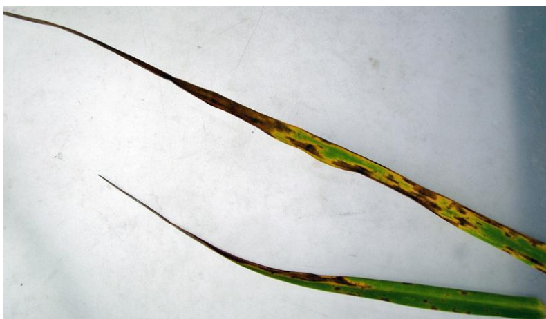
Blad av engsvingel angrepet av engsvingelbrunflekk.

Det har vært en økende forekomst av soppsjukdommer i engfrøavlens de siste åra. I engsvingel er svingelbrunflekk ( Drechslera dictyoides ) vanligst. Soppen viser seg som små brune flekker som vokser raskt og snart dekker hele bladflaten. Etter hvert vil store deler av bladet gulne og bladspissene visne (se bildet nedenfor). Brunflekk-soppen overlever på smitta planterester på bakken eller i infiserte blad på overvintra planter. I tillegg overføres soppen via frøsmitte.