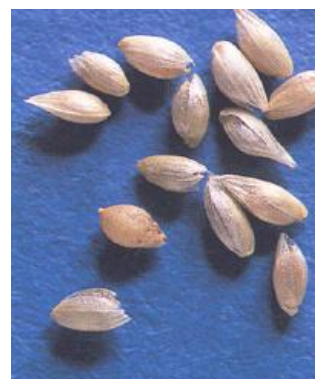
Frø av timotei.

For hard tresking kan føre til avskalla timoteifrø med lavere frøvekt.