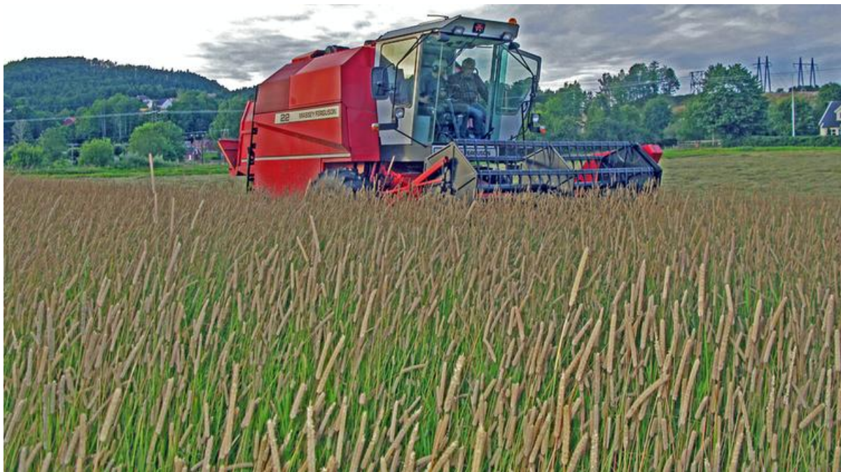
Direkte tresking av timoteifrøeng.

Anbefalt høstestrategi har helt siden 1960-tallet vært å treske timoteifrøenga to ganger. Første gangs tresking gjøres når frøene begynner å slippe og det er antydning til dryssing helt øverst i akset. Mest sikkert er det å prøvetreske og se hva som kommer i tanken og hvor mye som ligger igjen i loa. Fargen på frøene i tanken bør være mer gul enn grønn, og vanninnholdet bør ikke være over 35%. Vanninnholdet kan enkelt bestemmes ved å veie inn 100 g i en metallskål (fjern mest mulig av stubb og agner først). Vekttapet etter en times tørking ved 130 °C i steikeovn tilsvarer da vanninnholdet i frøvaren.