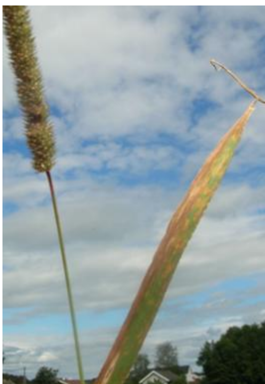
Timoteiblad angrepet av soppsjukdommen timoteibrunfleck.

Mot soppsjukdommer i timoteifrøeng har medlemmer av Norsk frøavlerlag off-label godkjenning for sprøyting med Proline i dosen 40 - 80 ml/daa.