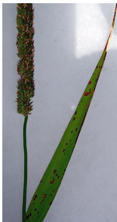
Soppsjukdommen timoteiøyefleck på timoteiblad.

For å unngå resistensutvikling kan Proline benyttes maksimalt to ganger pr vekstsesong. Tidspunkt for bekjemping er ved begynnende angrep, vanligvis i perioden mellom begynnende strekningsvekst og blomstring. Ved tidlige angrep er det mulig å tankblande sopp- og vekstreguleringsmiddel (Stabilan 750/CCC 750/Cycocel 750, Moddus M, Moddus Start/Moddevo eller Trimaxx). Problemene med sopp dukker imidlertid gjerne opp fra blomstring og fram til høsting. Av den grunn er det vanskelig å bedømme behovet for soppsprøyting når enga er klar for første vekstregulering, og som regel vil det derfor lønne seg å vente med sprøyting til rundt skyting. Størst behov for soppsprøyting vil det være i regnfulle somre, spesielt i "kraftig" frøeng med høyt legdepress.