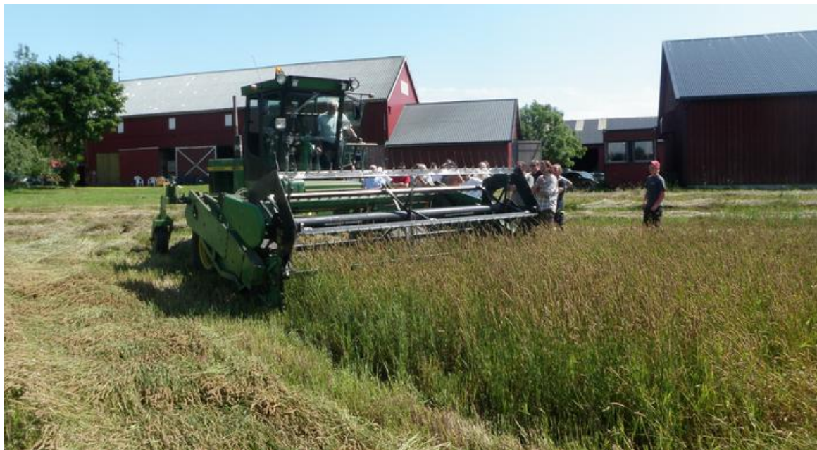
Skårlegging av timoteifrøeng.

Skårlegging av frøenga før tresking er et alternativ som er prøvd ut i forsøk de siste åra. I middel for sju høsteforsøk i timoteifrøeng i 2009-12 ble de høyeste frøavlingene berget på ruter som var høstet på tradisjonell måte med direkte skurtresking i to omganger. Skårlegging før tresking, enten tidlig (40-45 % vann i frøet) eller seint (30-35 % vann i frøet) reduserte avlingsnivået med henholdsvis 6 og 13 %.