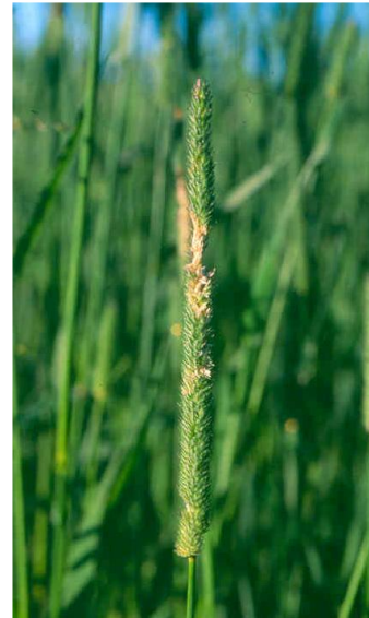
Skade av timoteiflue.

Dersom vi ved grundig kontroll finner egg på mer enn 5 % av stråene, er det aktuelt å sprøyte. Bruk et pyretroidmiddel, f.eks. Karate 5CS (15 ml/daa) eller Decis (12,5 ml/daa). Karate 5 CS er mest aktuelle hvis det også skal sprøytes mot kvitaksmidd.