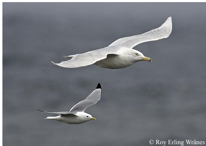
På Slettnes er det gode muligheter for å se flere ulike måkearter som polarmåke (øverst) og krykkje.

Kjører du bil langs E6 tar du av mot nord i Lakselv. Det står skiltet mot Ifjord, og du skal da være på FV98. Etter 12 mil er du fremme i Ifjord og tar til venstre mot Mehamn/Kjøllefjord langs FV888. Fra Ifjord til Mehamn er det 10 mil. Vær oppmerksom på kolonnekjøring om vinteren. Ring 175 for nærmere opplysninger.