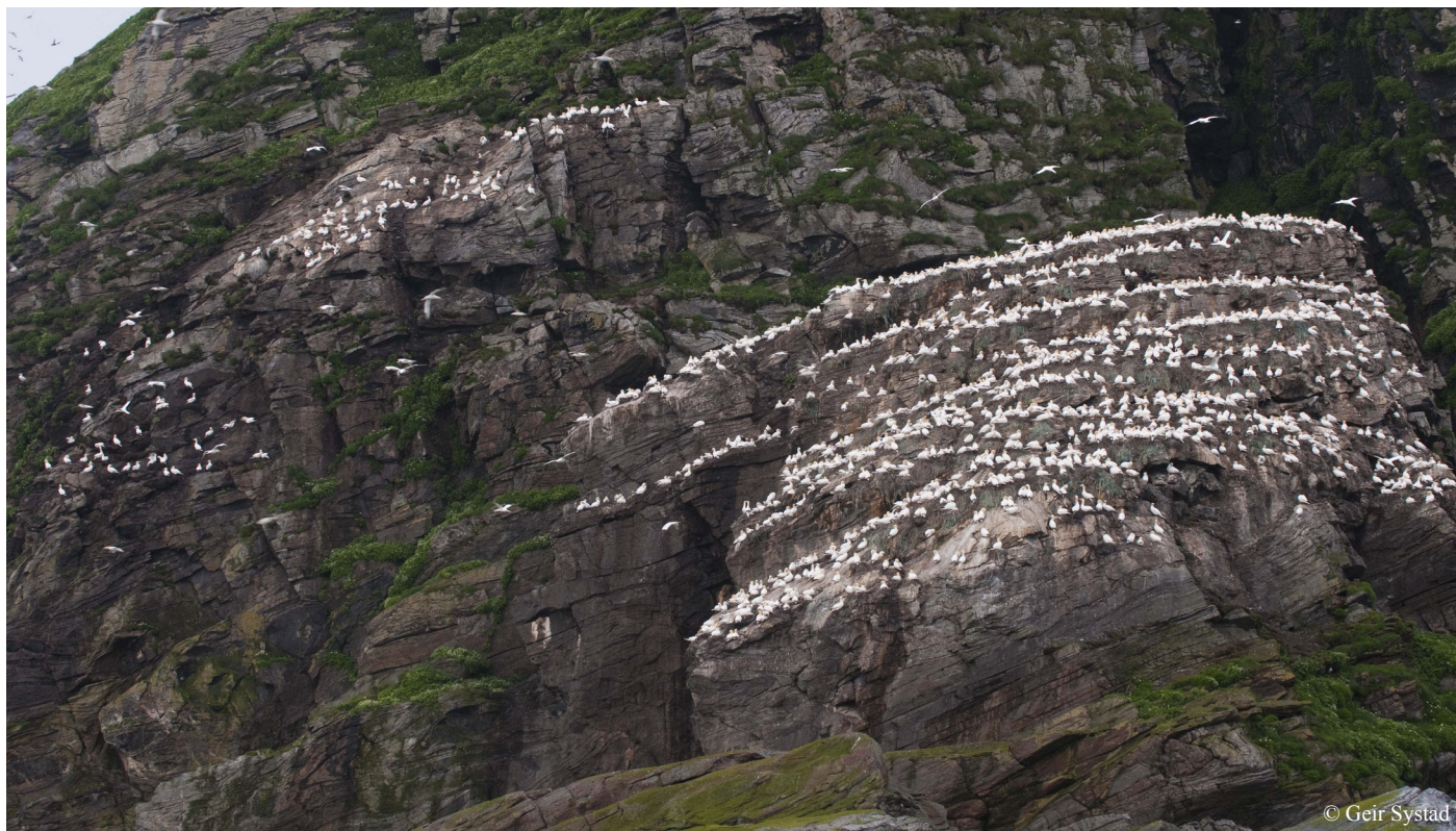
Det begynner å bli trangt om plassen i havsulekolonien, og noen par har startet å hekke ovenfor knausen hvor de har holdt til siden 1987.

det et flatt, lav- og mosekledd platå. Fuglegjødslingen er mindre utpreget på Kjerkestappen og Bukkstappen, selv om disse øyene også er grønnere enn terrenget inne på Magerøya. Vegetasjonen her er krekling- og lyngdominert. Nordsiden av Kjerkestappen er mer lik Storstappen.