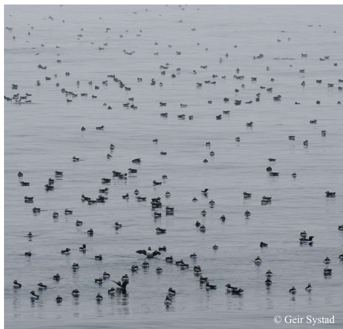
Lunde i tåkehav

På Kjerkestappen og Bukkstappen er det ikke ferdselsforbud, men man må holde god avstand til storskarvkolonien. Det er både vanskelig å komme i land på Storstappen og å komme seg rundt på denne øya. Vanligste vegen til toppen er ei stor renne på den sørvestlige delen. Framkommeligheten ellers er nokså dårlig på grunn av bratt terreng og gjennomhullete gressbakker. Kjerkestappen er lettere å komme i land på fra sørsiden. Det er relativt enkelt å nå toppen av denne øya, hvor man har utsyn over store deler av Storstappen og havet utenfor. Bukkstappen er en lavere øy med god framkommelighet.