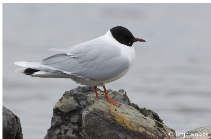
Ved utløpet av Pasvikelva og i den indre delen av Bøkfjorden kan dvergmåke observeres