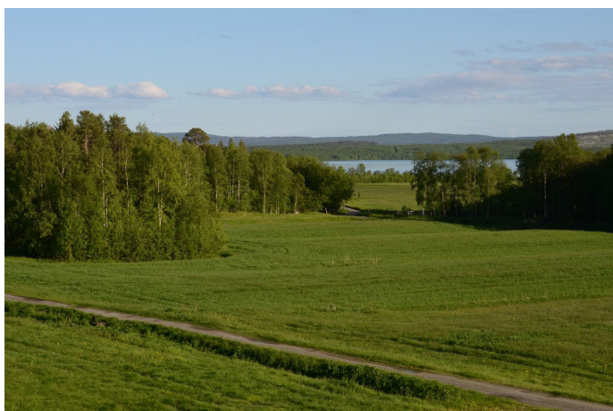
Utsikt mot Mellomneset fra Bioforsk Svanhovd

28 km sør for Hesseng (seks km nord for Svanvik). Ta av mot høyre ved skiltet «Strand» og «Bjørnehi». Flere syngende lappsangere er hørt langs denne veien i de senere år, både på oversiden og nedsiden av veien.