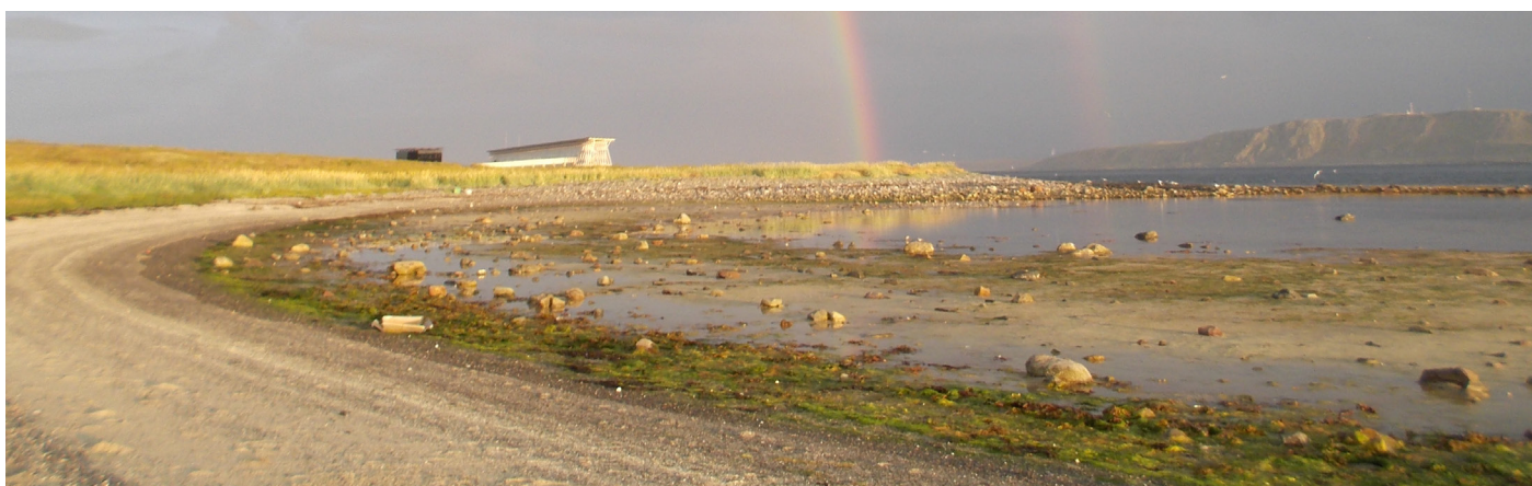
Sunndammen er den mest spennende lokaliteten for vadere og spurvefugl