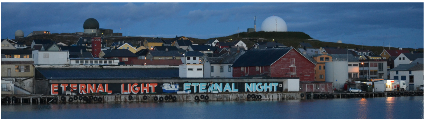
Vardø er Norges østligste by og har et fantastisk fugleliv

Vegetasjonen på Vardø er frodigere enn på fastlandet. Årsaken er at det ikke er noe beitetrykk av reinsdyr på øya. Inne på øya finnes områder med en del vier, og enkelte hager har også noe høyere vegetasjon. En av de mest spennende lokalitetene på øya er Sunddammen. Den ligger rett nedenfor den gamle festningen. Dette er den beste lokaliteten på øya for vadere og spurvefugler. Det er et lett oversiktlig område med en liten bukt og frodige vierkjerr. Temmincksnipe, sivsanger, polarsisik og lappiplerke er vanlige hekkefugler. I de fleste år finnes det også en koloni med rødnebbterne. Den