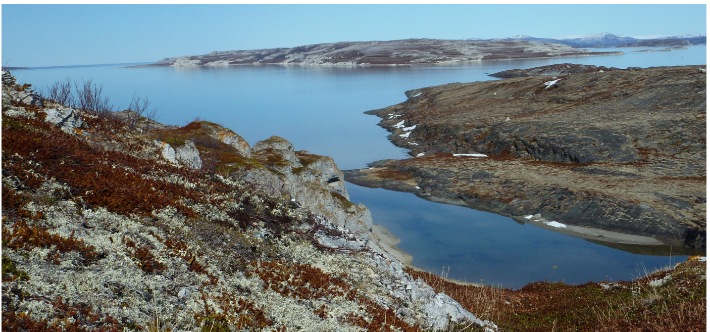
Leavdnjavuonas leat vällji eallit maid mearrasápmelaččat alu leat ávkkestallan

Leavdjavuotna lea erenoamáš dan dafus go dán vuonas leat nu ollu sullo ja lássát, oktii buot 250. Dákkár vuotnabiras lea dán guovllu mearrasápmelaččaide addán buriid vejolašvuodaid resursaávkkestallamis. Nu go 1500-logu čáluš muitala de jođášedje mearrasápmelaččat sierranas orohagaid gaska jagi áigodagaid mielde. Olgolis vuonas ja sulluin ledje geasseorohagat. Knud