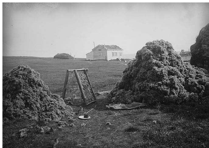
Uvjjat ledje dehálaš gávpegálvun Leavdnjavuonas