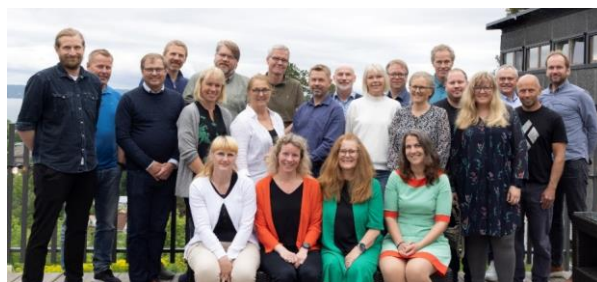
Geovekstforum 2022 – 30års jubileum (med noe frafall)