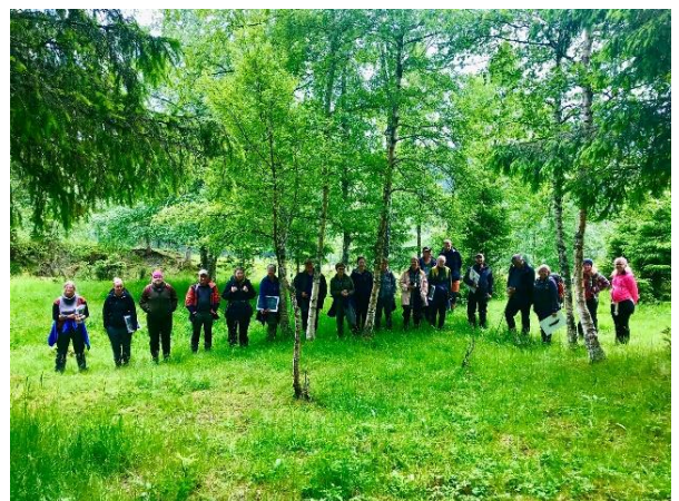
Feltkurs i Stjørdal.

Fylkene Viken, Vestland, Trøndelag og Troms og Finnmark ble besøkt i år. Planleggingen for 2023 er ikke i gang enda, så det er mulig å ønske seg feltkurs til ditt fylke neste år. Ta kontakt! I 2023 kan det også være aktuelt å ha feltkurs på høsten, i tillegg til våren/sommeren.