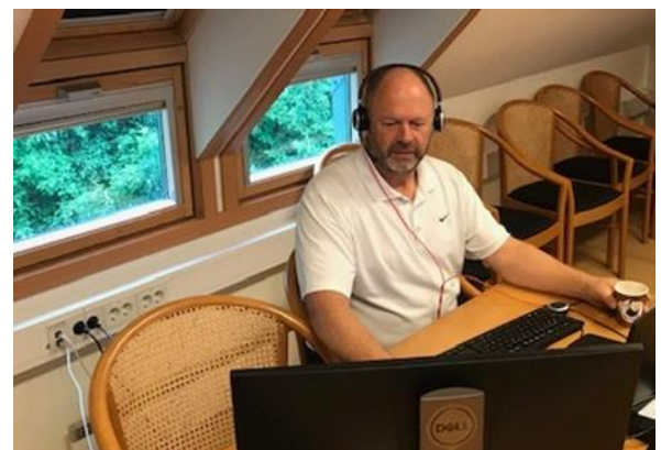
Fra feltkurs i korona-tid 2020.

Mer informasjon om datoer, påmelding og praktisk gjennomføring vil bli sendt ut via Statsforvalteren i løpet av uke 16.