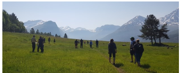
Feltkurs 2023, Møre og Romsdal.

Invitasjon og påmelding skjer via Statsforvalteren.