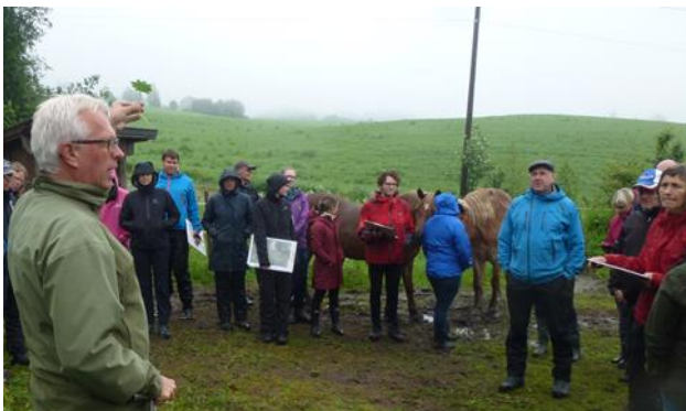
Fra feltkurs i Oppland 2019.