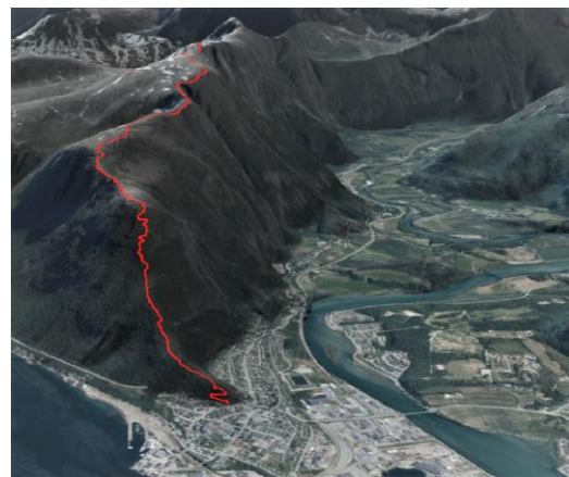
Kilden: gpx-spor over Romsdalseggen vist i 3D.