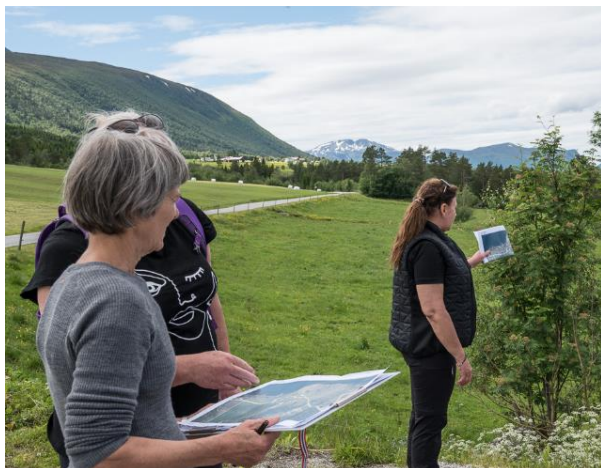
Fra kurs i Vestnes i 2019.

Vi sender ut informasjon om kurs til FMLA i begynnelsen av februar.