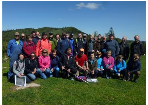
Bilde fra kurset i Vennesla, Agder.

Det har vært stor oppslutning om kursene. Hele 162 deltagere til sammen. På Gjøvik fikk vi også besøk av Landbruksdirektoratet som ville lære mer om AR5, det er positivt!