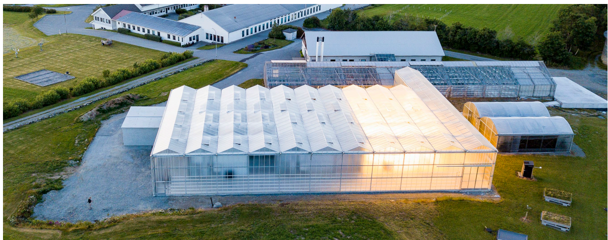
Nyhet 03.03.2022: Slik kan vi få klimavennlige veksthus.

Antall faglige årsverk per rene administrative årsverk utgjorde 6,0 for 2022, mot 6,2 for 2021.