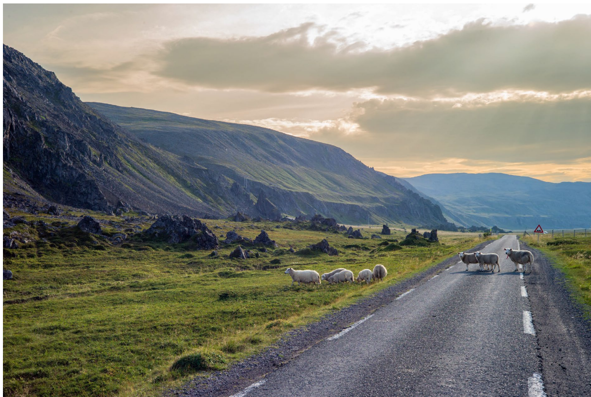
Sauer på beite langs Hamningbergveien, Båtsfjord.