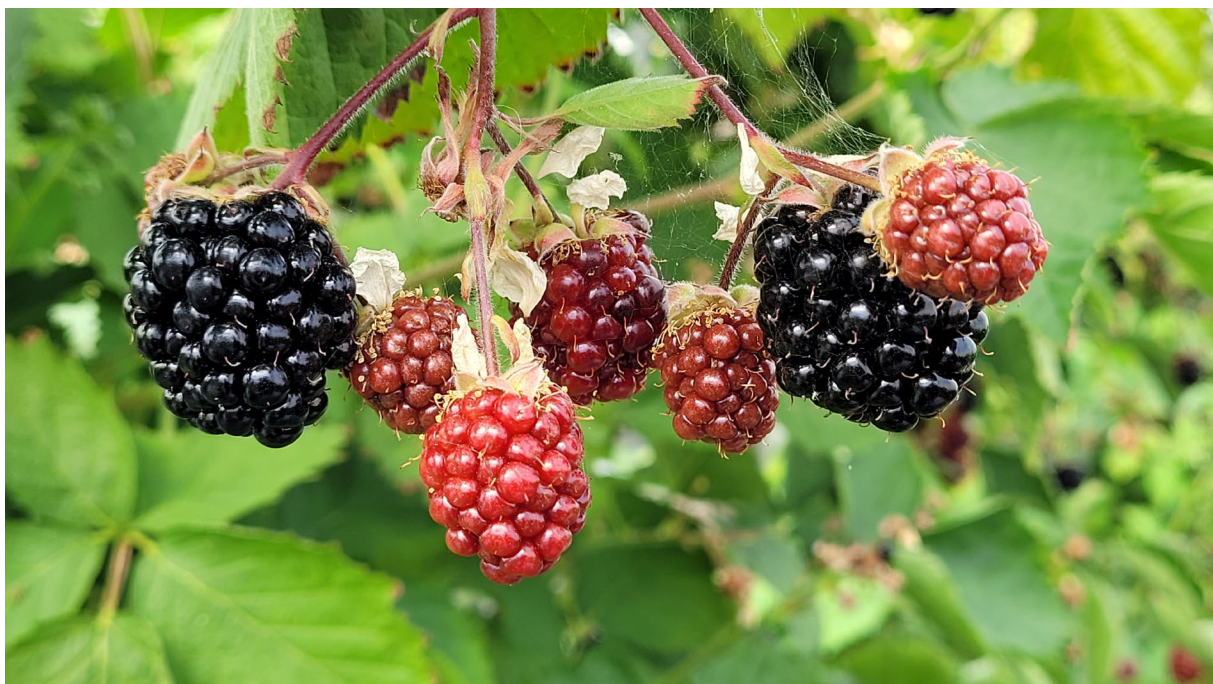
Nyhet 27.08.2022: Har trua på norske bjørnebær.

Prosjektinntekter fra tilskudd har økt med 29 mill. kr. Hovedårsakene er økt prosjektinngang. Inntekt fra oppdrag er økt med 16 mill. kr. Totalt er inntekter økt med 93 mill. kr hovedsakelig grunnet økt aktivitet, høyere verdi av timeproduksjon, økte prosjektkostnader dekket i prosjekter av oppdragsgiver, økt frøsalg, husleie, og refusjon av strømkostnader.