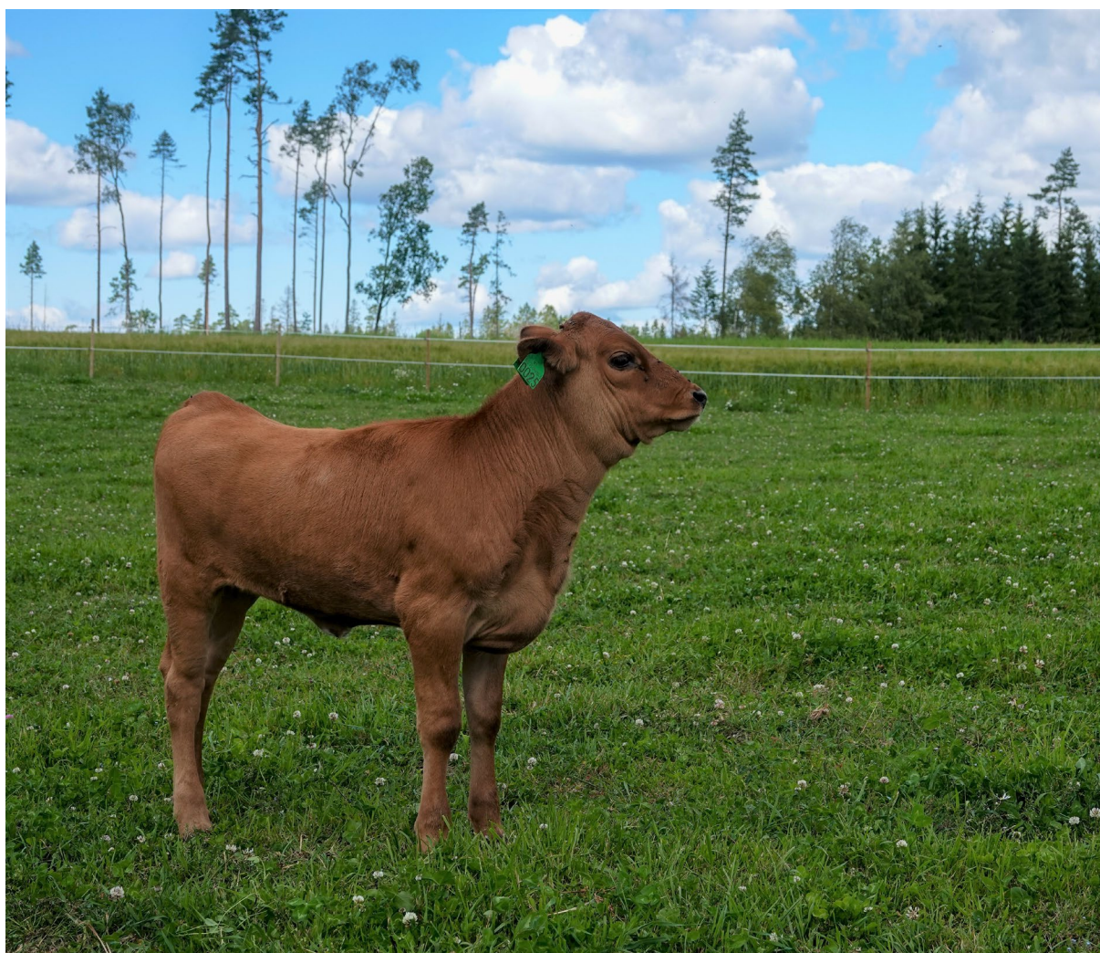
Kalv av østlandsk rødkolle, Melleby gård, Rakkestad.