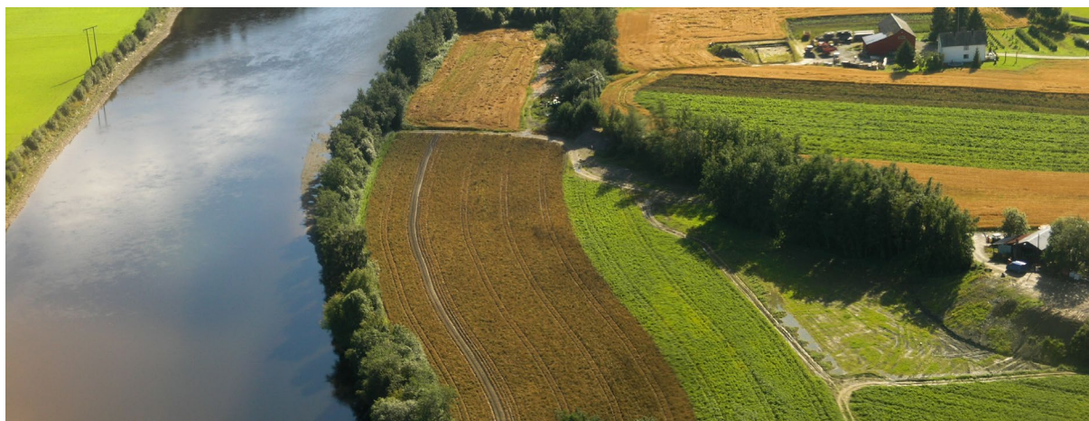
Nyhet 31.01.2022: Vil ferskvannet i Norden tåle det grønne skiftet?